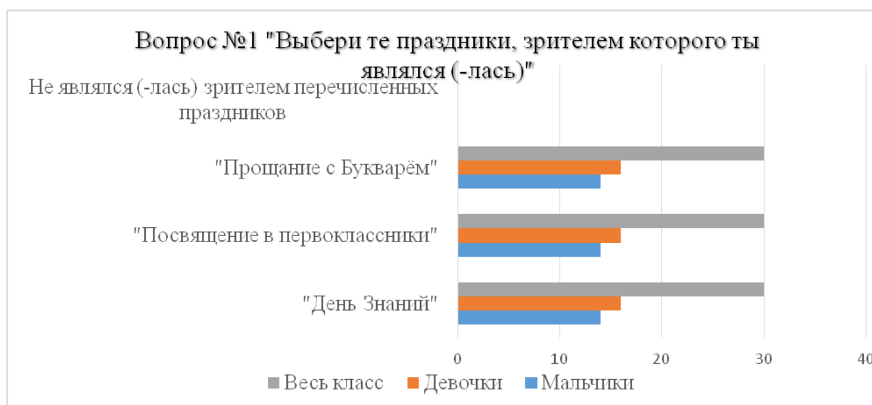
Рисунок 2 – Праздники, зрителями которых учащиеся являлись

В первом вопросе анкеты респондентам предлагалось выбрать те праздники, на которых ребята были зрителями.