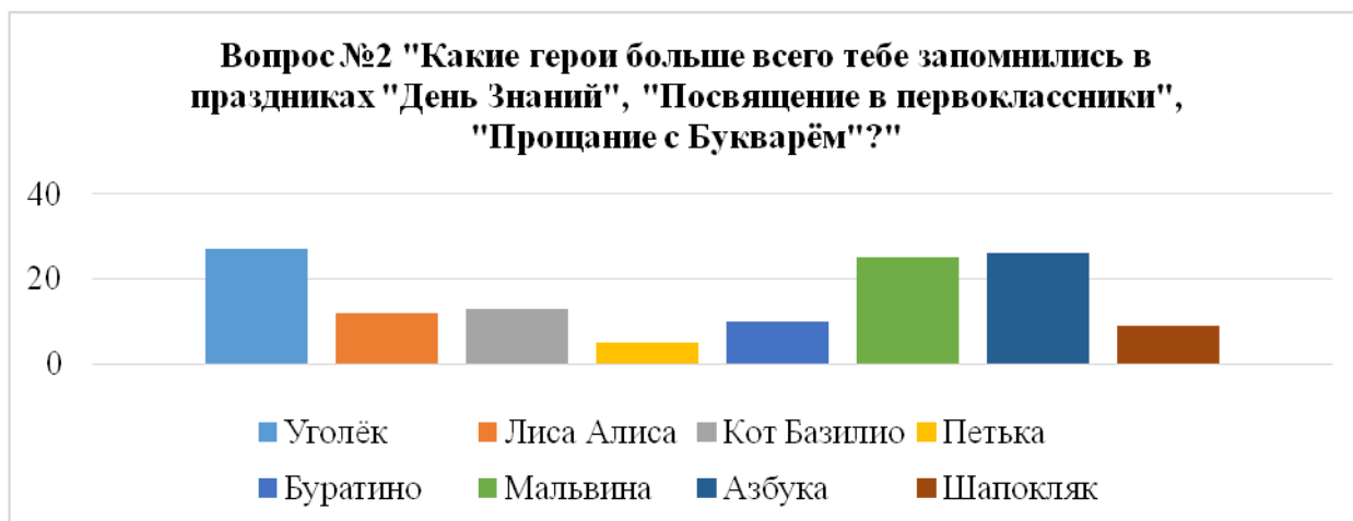
Рисунок 3 – Герои, которые больше всего запомнились учащимся

Итак, исходя из анализа рисунка 3 можно сделать вывод, что респонденты отдали больше голосов таким персонажам как: Уголёк (27 учащихся), Мальвина (25 учащихся), Азбука (26 учащихся). Все три героя, лидирующих в предпочтениях респондентов, в праздничных действиях являлись положительными персонажами, которые рассказывали о добре, о важности знаний и хорошей учёбы. Таким образом, младшие школьники предпочитают положительных персонажей. (Рисунок 3)