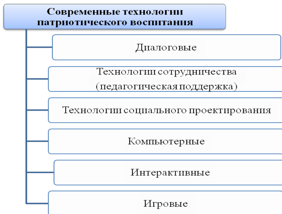
Рис.1. Технологии патриотического воспитания

Диалоговые технологии. Данные технологии используются на различного рода практических занятиях, факультативах, при организации бесед, дебатов, дискуссий. Высказывая свою точку зрения, ведя диалог, ребенок в большей степени раскрывает свои личностные качества, лучше усваивает патриотические знания, выражает гражданско-патриотические чувства. Помощь педагога заключается в организации обсуждения, в ненавязчивом ведении разговора в нужном русле, в создании мотивации для самоопределения личности, осознании своих и общих интересов.