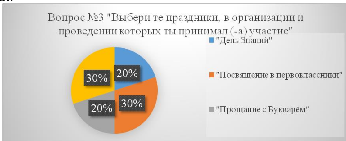
Рисунок 4 – Праздники, в которых учащиеся принимали участие

В вопросе № 3 анкеты респондентам предлагалось выбрать те праздники, в организации и проведении которых учащийся принимал участие.