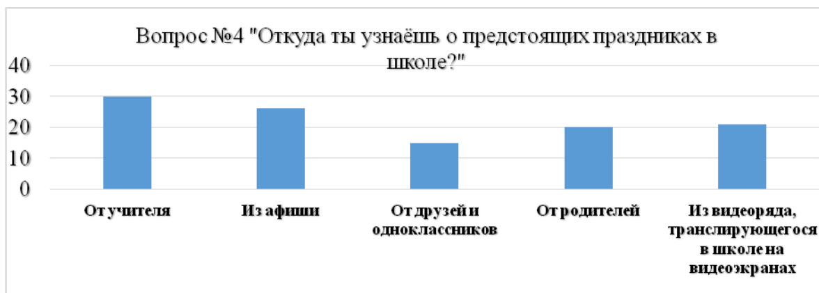
Рисунок 5 – Информирование учащихся о предстоящих праздниках

Из рисунка 5 видно, что респонденты о предстоящих праздниках в школе чаще всего узнают от учителя (30 учащихся), из афиши (26 учащихся), из видеоряда, транслирующегося на видеозэкранах школы (21 учащийся) (Рисунок 5).