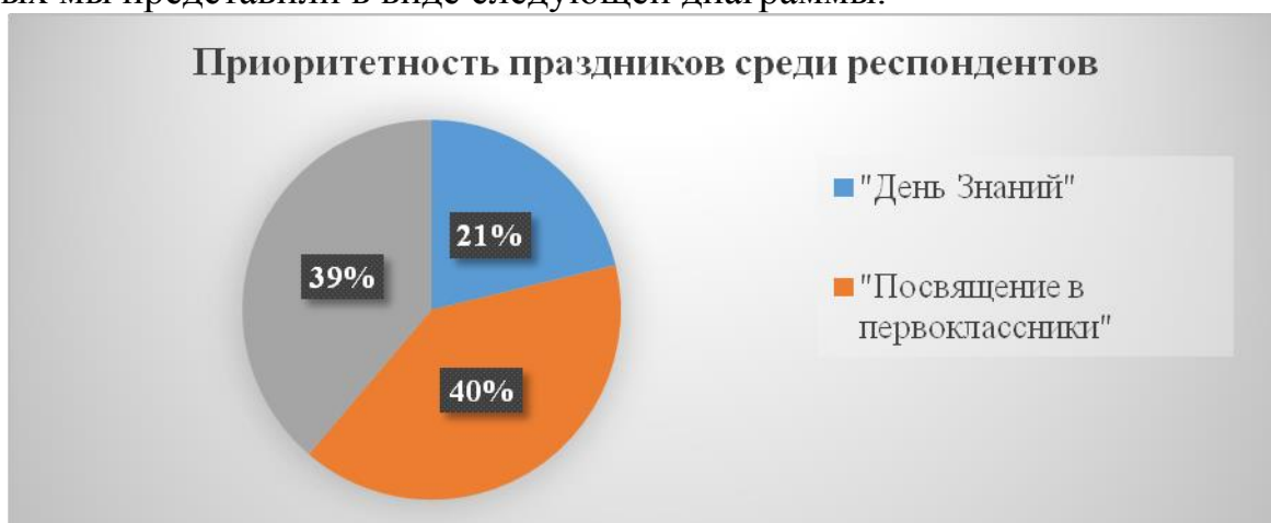
Рисунок 6 – Приоритетность праздников среди респондентов

Для выявления приоритетности праздников среди респондентов мы посчитали позитивные выборы для каждого из трёх праздников, результаты которых мы представили в виде следующей диаграммы.